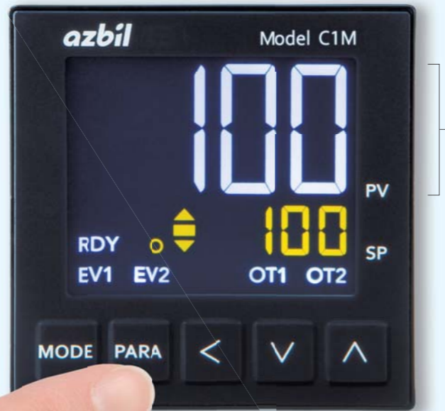
(尺寸) H48 × W48 mm